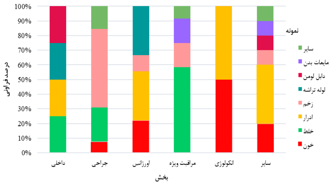
شکل ۱. توزیع جدایه‌های سودوموناس آنروژینوزا برحسب بخش و نمونه