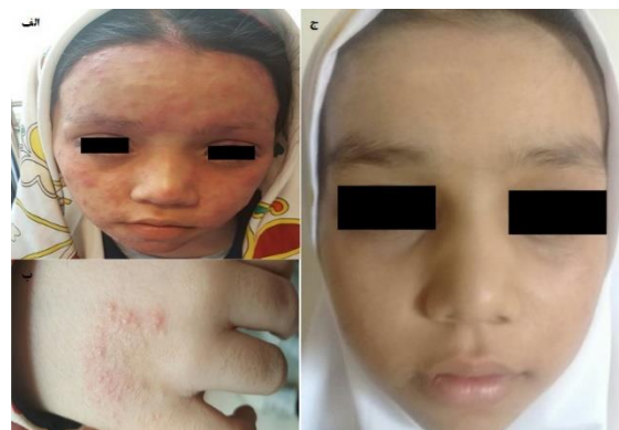
شکل ۱. تصویر ضایعات اولیه الف- روی صورت، ب- روی دست بیمار و ج- تصویر بهبودی کامل بیمار پس از ۴۵ روز

موجود بود (شکل ۱). علاوه بر آن، پوسچول‌های مجزا در بین موهای بیمار و بر روی سر بیمار مشاهده می‌شد. هیچ گونه درگیری مخاطی در شرح حال و معاینه‌ی بیمار وجود نداشت. بیمار، علائم تلازک، پوبارک و آکانتوزیس نیگریکنس را به طور مختصر نشان می‌داد.