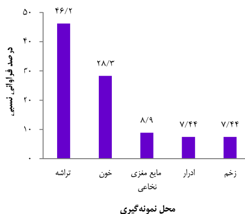
شکل ۱. درصد توزیع فراوانی نسبی نمونه‌های بالینی ایزوله شده بر حسب محل نمونه‌گیری

در این مطالعه، از ۳۲ سویه‌ی جدا شده‌ی مربوط به بیمارستان امام