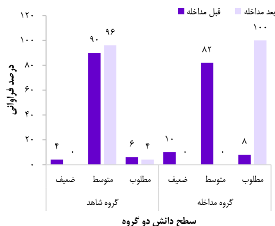
شکل ۱. درصد فراوانی سطح آگاهی دو گروه مورد و شاهد در قبل و بعد از مداخله

به طور کلی، می‌توان گفت در هر تلاشی که برای ایجاد رفتار بهداشتی انجام می‌گیرد، داشتن اطلاعات و آگاهی اولین عنصر لازم و کلیدی است (۱۶). بنابراین، ارتقای دانش بیماران مبتلا به سلیاک در زمینه‌ی تغذیه در کنار عوامل حمایتی، می‌تواند موجب ایجاد رفتار و شیوه‌ی زندگی سالم شود. در این زمینه، نتایج مطالعات Muhammad و همکاران در قفقاز و جنوب آسیا (۱۷) و Halmos و همکاران در استرالیا و نیوزلند (۱۸) نیز نشان داد بیمارانی که نسبت به مواد غذایی بدون گلوتن و برچسب‌گذاری آن‌ها آگاهی دارند، بیشتر از سایرین از رژیم غذایی تبعیت می‌کنند. همچنین، نتایج مطالعه‌ی Roma و همکاران نیز که در زمینه‌ی تبعیت از رژیم غذایی و سبک زندگی در کودکان مبتلا به بیماری سلیاک انجام شده است،