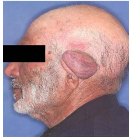
شکل ۱. نمای ظاهری توده

ضایعه‌ای در ناحیه‌ی پشت گوش سمت چپ با قوام چربی بدون هیچ گونه ارتباط با سیستم اعصاب مرکزی و یا اعضای مجاور و نیز بدون بافت عروقی گزارش گردید (شکل ۲).