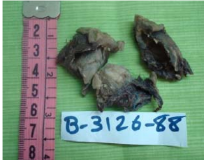
شکل ۳. نمای ماکروسکوپی ضایعه پس از عمل