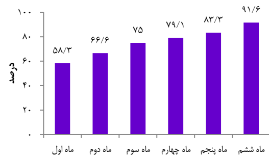
شکل ۲. مقایسه‌ی و ارزیابی اجرای فرآیند غربالگری نوزادان به وسیله پالس اکسیمتری به تفکیک ماه

همچنین در مطالعه‌ی نوایی و همکاران که با هدف بررسی میزان آگاهی پزشکان از غربالگری نوزادان به وسیله پالس اکسیمتری انجام شد، نشان داد پزشکان به ویژه متخصصین کودکان نیاز به آگاهی بیشتری در زمینه‌ی غربالگری نوزادان به وسیله پالس اکسیمتری دارند (۳).