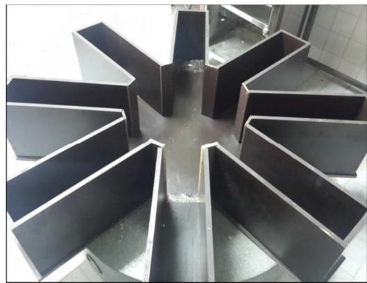
شکل ۱. دستگاه ماز شعاعی ۸ بازویی

آزمایش یادگیری و حافظه‌ی فضایی به روش ماز شعاعی: در ابتدا و پس از اتمام دوره‌ی آزمایش، وزن رت‌ها به دقت با استفاده از ترازوی دیجیتال (با دقت ۰/۰۰۱ گرم) توزین شد. به منظور سنجش آزمون یادگیری، از دستگاه رفتاری ماز شعاعی ۸ بازویی چوبی (شکل ۱) استفاده شد. این سیستم، شامل ۸ بازوی یکسان شعاعی است که از یک صفحه‌ی مرکزی کوچک دایره‌ای شکل منشعب می‌شوند. این طرح، تضمین می‌کند که بعد از این که حیوان برای یافتن غذا به انتهای یکی از بازوها می‌رود، برای این که به بازوی دیگر برود، مجبور است که به صفحه‌ی مرکزی برگردد. در نتیجه، حیوان همیشه ۸ گزینه‌ی ممکن را جهت حرکت دارد. در این سیستم، یک بازوی ثابت با یک ظرف مخفی همیشه محتوی غذا است. هنگام آزمون رفتاری، رفتار حیوان به وسیله‌ی یک دوربین دیجیتال که در بالای ماز شعاعی به سقف آزمایشگاه فیزیولوژی رفتاری نصب شده بود، فیلم‌برداری شد و پس از اتمام آزمون، فیلم به کامپیوتر منتقل و مشاهده و اطلاعات مورد نیاز یادداشت گردید.