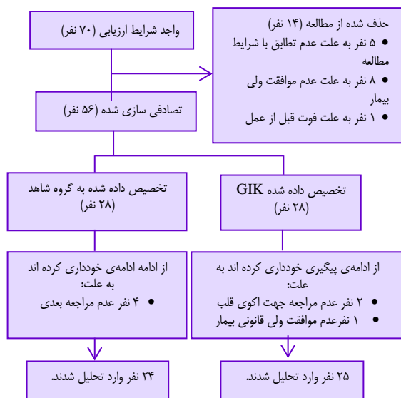
شکل ۱. نمودار Consort افراد شرکت کننده در مطالعه

بیشتر مطالعات پیش‌گفته، در بیماران مبتلا به دیابت و یا بزرگسالان انجام شده بود و مطالعه‌ای در مورد اثربخشی محلول GIK بر پیامدهای بالینی پس از عمل جراحی قلب در کودکان انجام نشده بود. از این رو، با توجه به شرایط بدنی کودکان، در این کارآزمایی بالینی، اثربخشی محلول GIK بر پیامدهای بالینی پس از اعمال جراحی قلب اطفال تحت پمپ قلبی-ریوی بستری در مرکز آموزشی-درمانی شهید چمران اصفهان بررسی گردید.