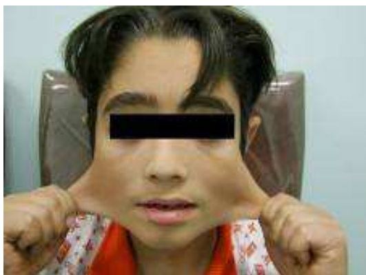
شکل ۱. افزایش قابلیت ارتجاعی پوست در سندرم اهلرز- دانلس

و مادر وی نسبت فAMILI نداشتند و سابقه‌ی ضایعات مشابه در گذشته و نیز در افراد خانواده ذکر نمی‌شد. بنابر گفته‌ی مادر، بیمار در هنگام تولد نارس (Premature) نبوده و با زایمان طبیعی متولد شده بود. بعد از تولد، به جز صاف بودن کف پا اختلال دیگری نداشت و به تدریج شلی عضلانی و تأخیر در کسب مهارت حرکتی در وی ایجاد شده بود. بیمار در سن ۲ سال و ۸ ماهگی شروع به راه رفتن کرده بود. در تاریخچه‌ی وی، شکستگی استخوان‌های مچ پای دو طرف و ساق پا در اثر ضربه، دررفتگی مکرر مچ دست و پا، خستگی زودرس، افزایش زمان خواب، تأخیر در ترمیم زخم و کبودی آسان وجود داشت ولی سابقه‌ای از خونریزی یا پارگی ارگان‌های داخلی ذکر نمی‌شد. در معاینه، حال عمومی بیمار خوب بود. ندول‌های کوچک زیرجلدی با دردناکی (Tenderness) خفیف در ساعد راست، ضایعه‌ی پوستی ندولر با سطح زخمی، برجسته و قهوه‌ای رنگ در آرنج چپ و نیز ندول خاکستری رنگ در پوست زانوی راست وجود داشت. پوست، قوام نرم، شلی و قابلیت ارتجاعی زیاد داشت (شکل ۱) و در ناحیه‌ی شکم تا حدودی چین خورده به نظر می‌رسید. پوست، نازک و شفاف نبود.