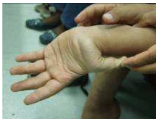
شکل ۲. دورسی فلکشن انفعالی انگشت شست به سمت ساعد

ضایعه‌ی هیپرموبیلیتی بر اساس نمره‌بندی Beighton بررسی شد که انگشت کوچک هر دو دست بیمار به صورت انفعالی و بیش از 90 درجه به عقب خم (Dorsiflexion) و آرنج‌ها نیز به طور انفعالی بیش از 10 درجه باز (Hyperextension) می‌شد. Dorsiflexion تا سطح فلکسور ساعد فقط در انگشت شست چپ دیده می‌شد (شکل ۲). به گفته‌ی مادر بیمار، وی پیشتر می‌توانست کف هر دو دست خود را بدون خم شدن زانو به سطح زمین برساند (از معیارهای بیگتون). در ستون فقرات بیمار هیچ گونه ناهنجاری دیده نمی‌شد. بیمار از نظر بینایی مشکلی نداشت. در اکوکاردیوگرافی، دریچه‌ها سالم بود و شواهدی از آنوریسم دیده نمی‌شد. آزمایش‌های معمول نیز نکته‌ی خاصی را نشان نمی‌داد.