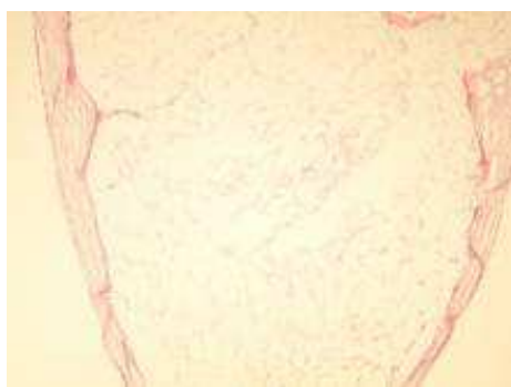
شکل ۳. نکروز چربی تروماتیک در اسفروئید زیرجلدی (بزرگ‌نمایی ۱۰۰)

ندولر خاکستری رنگ به اقطار 1/5 \times 1/3 سانتی متر و ضخامت 0/8 با ناحیه‌ی قهوه‌ای رنگ برجسته و زخمی به قطر 1 سانتی متر و در زانوی راست، ندول پوستی با سطح خاکستری رنگ به قطر 1/5 و ضخامت 0/8 سانتی متر با قوام نیمه سفت و سطح مقطع با نواحی قهوه‌ای رنگ وجود داشت. در بررسی میکروسکوپی ندول ساعد راست، بافت چربی نکروتیک دیده می‌شد (شکل ۳) که توسط لایه ضخیمی از کلاژن متراکم احاطه گردیده بود. این ضایعه با نکروز چربی تروماتیک مطابقت داشت که به