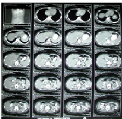
شکل ۱. سی‌تی اسکن شکم بیمار در بدو ورود

انجام شد که نتایج آن‌ها طبیعی بود و هیچ تظاهراتی از بدخیمی دیده نشد. اکوکاردیوگرافی نشان‌دهنده‌ی تجمع خفیف مایع در پریکارد بود. در سونوگرافی شکم و لگن، بزرگی کبد و طحال دیده شد (Span) طحال ۱۷ سانتی‌متر بود). سی‌تی اسکن اسپیرال در سومین روز بستری صورت گرفت که نشان‌دهنده‌ی بزرگی کبد و طحال، ضایعات هایپودنس متعدد کوچک در هر دو لوب کبد و طحال، تجمع دو طرفه‌ی مایع در فضای جنب و بزرگی گروه‌های لنفاوی اطراف آئورت بود (شکل ۱).