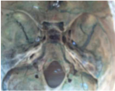
شکل ۳. سوراخ کاروتیکوکلنویید نوع سالم

در ۲ جمجمه سوراخ کاروتیکوکلنویید کامل (Complete) (شکل ۴) به صورت دو طرفه و در ۱ جمجمه به صورت یک طرفه مشاهده شد.