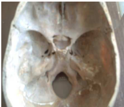
شکل ۴. سوراخ کاروتیکوکلنویید نوع کامل

میانگین اندازه‌ی عرضی سوراخ کاروتیکوکلنویید در ۱۲ جمجمه ۵/۵۴ میلی‌متر بود. در سوراخ‌های کاروتیکوکلنویید ناکامل میانگین فاصله بین زائده‌های کلنویید قدامی و میانی ۷/۹۴ میلی‌متر اندازه‌گیری شد. میانگین طول زواید کلنویید قدامی در سوراخ کاروتیکوکلنویید ناکامل ۱۱/۳۳ میلی‌متر و در سوراخ کاروتیکوکلنویید سالم ۹/۸۰ میلی‌متر بود.