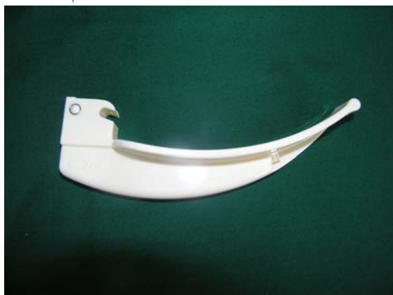
شکل ۱. تیغه‌ی لارنگوسکوپ یک‌بار مصرف مکیتاش مارک Topster (ساخت تایوان)

Cormack و Lehane، درجه‌ی I: گлот به طور کامل دیده می‌شود، درجه‌ی II: فقط انتهای خلفی گлот قابل دید است، درجه‌ی III: فقط اپیگлот قابل دید است و درجه‌ی IV: فقط کام سخت دیده می‌شود). میزان روشنایی ناحیه‌ی گлот نیز بر اساس نظر فرد لوله‌گذار با visual analogue scale از ۰-۱۰ نمره‌گذاری گردید. به این صورت که به بیشترین میزان روشنایی ناحیه‌ی گлот در هنگام لارنگوسکوپی نمره‌ی ۱۰ و به کمترین میزان روشنایی ناحیه‌ی گлот نمره‌ی صفر تعلق می‌گرفت. زمان لوله‌گذاری نای در دومین لارنگوسکوپی از هنگام ورود لارنگوسکوپ به دهان بیمار تا رد شدن لوله از بین تارهای صوتی اندازه‌گیری شد. رضایت فرد لوله‌گذار در هر بار لارنگوسکوپی به صورت مطلوب، قابل قبول و بد بیان شد. موفقیت لوله‌گذاری پس از تأیید محل مناسب لوله توسط دستگاه کاپنوگراف و سمع قرینه‌ی صدای تنفسی در هر دو ریه تعریف شد. در صورت افت اشباع اکسیژن شریانی به کمتر از ۸۵٪، لارنگوسکوپی قطع و پس از اکسیژناسیون بیمار، دوباره لارنگوسکوپی انجام شد.