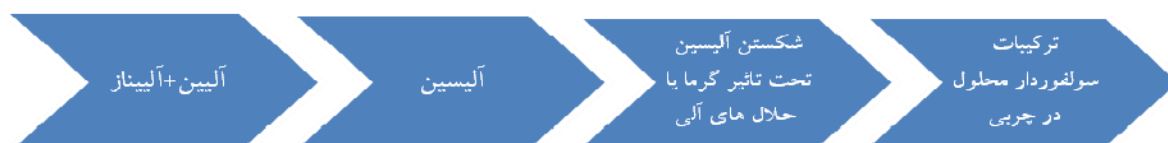
شکل ۲. مسیر تشکیل ترکیبات محلول در چربی گیاه سیر