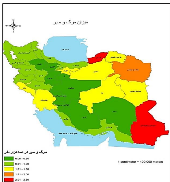
شکل ۳. توزیع پراکندگی میزان مرگ و میر ناشی از بیماری سل در هر صد هزار نفر بر حسب استان‌های کشور در ایران (۱۳۹۵) بر اساس داده‌های حاصل از نرم‌افزار (GIS) Geographic information system در مطالعه‌ی حاضر

میزان مرگ و میر بیماری در کشور ۱ نفر در هر صد هزار نفر جمعیت (تعداد ۷۳۵ مورد) که به تفکیک جنس ۱/۰۴ نفر در مردان و ۰/۸ نفر در زنان با میانگین سنی افراد 28/2 \pm 62/8 سال و دامنه‌ی سنی کمتر از ۱ تا ۹۹ سال بود. ۵۷/۷ درصد (۴۲۲ نفر) از فوت شدگان مرد و بقیه زن (نسبت جنسی مردان ۱/۳ برابر زن‌ها) بودند. همچنین، میزان مرگ و میر استاندارد شده در ایران، ۱/۱ در هر صد هزار نفر جمعیت به دست آمد. بیشترین میزان مرگ و میر در هر دو جنس (۱۷/۷) در هر صد هزار نفر جمعیت) مربوط به گروه سنی بیشتر از ۸۰ سال بود. بیشترین علت فوت ناشی از بیماری (۸۵ از کل موارد)، مربوط به سل ریوی با میزان بروز ۰/۸ در هر صد هزار نفر جمعیت بود. بیشترین میزان مرگ و میر را استان سیستان و بلوچستان با میزان مرگ و میر ۲/۳۰ در هر صد هزار نفر جمعیت و با اندکی تفاوت استان گلستان با میزان مرگ و میر ۲/۱۹ در هر صد هزار نفر جمعیت به خود اختصاص داده بودند (شکل ۳). در این مطالعه، به دلیل نامشخص بودن مخرج کسر افراد غیر ایرانی، از محاسبه‌ی آنان در مقادیر مرگ و میر و بروز بیماری، چشم‌پوشی شد.