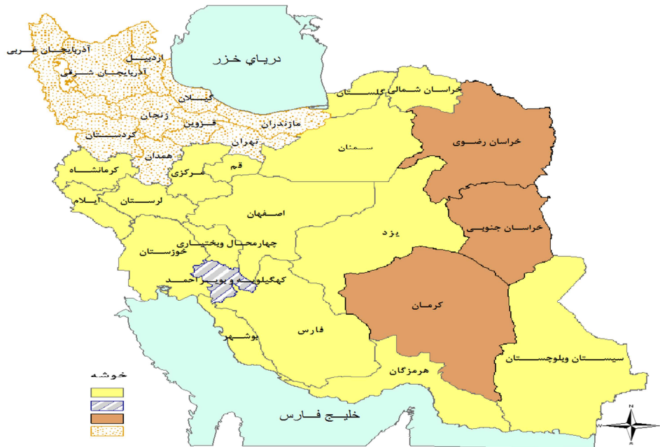
شکل ۱. پهنه‌بندی خوشه‌های سرطان معده در مردان با استفاده از آماره‌ی کاوشی فضا- زمان