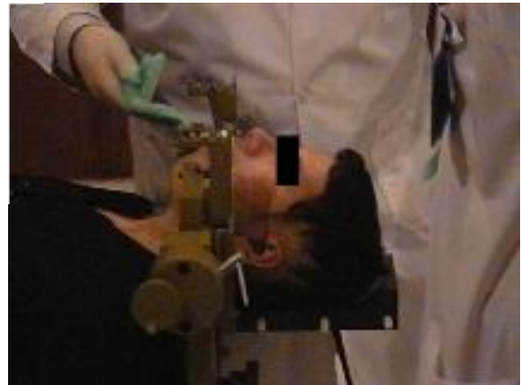
شکل 1. قرار دادن سر بیمار بر روی نگهدارنده‌ی سر (Head Ring) غیر تهاجمی

تهیه‌ی ماسک ترموپلاستیک و قالب دندان‌ها: ابتدا کچ استند به تخت درمان متصل می‌شود و سپس نگهدارنده‌ی سر غیرتهاجمی روی کچ استند نصب می‌گردد. در مرحله‌ی بعد سر بیمار به آرامی روی نگهدارنده‌ی سر منتقل می‌گردد (شکل 1).