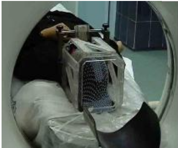
شکل 4. تصویربرداری سی‌تی از سر بیمار به همراه مکان‌یاب.

در انتخاب زاویه‌ی برش‌ها از موقعیت عمود کامل گنتری دستگاه باید استفاده شود، یعنی تمام برش‌ها باید بر تخت تصویربرداری عمود باشد. بهتر است برش‌ها از زیر ضایعه تا سقف جمجمه انتخاب شوند و ضخامت برش‌ها از 3 میلی‌متر به پایین با فاصله صفر میلی‌متر باشد (شکل 4).