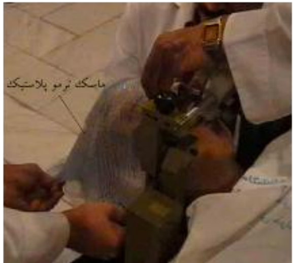
شکل 3. الف) قرار دادن گاز نخعی روی صورت؛