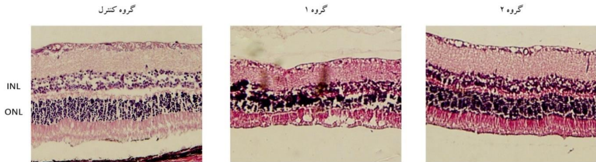
شکل ۱. مقاطع بافت‌شناسی شبکیه چشم رت‌ها پس از رنگ‌آمیزی با هماتوکسیلین و ائوزین با بزرگ‌نمایی ۴۰ برابر. ضخامت رتین در نمونه‌ی گذاشته شده از گروه شاهد ۲۴۶ میکرون می‌باشد. ضخامت رتین در نمونه‌ی گروه ۱ (آب اکسیژنه) و گروه ۲ که محیط رویی را دریافت کردند به ترتیب ۱۸۴ و ۲۲۸ میکرون می‌باشد. به آتروفی لایه‌ی هسته‌ای داخلی و لایه‌ی هسته‌ی خارجی و نازک‌شدگی و به هم ریختگی لایه‌ها در نمونه‌ی گروه ۱ دقت کنید. ONL: Outer Nuclear Layer; INL: Inner Nuclear Layer

SCAP-CM دریافت کرده بودند به طور قابل توجهی پایین‌تر بود (شکل ۱).