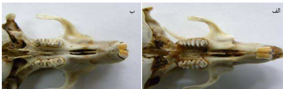
شکل ۳. وضعیت دندان‌های آسیای اول، دوم و سوم الف- در گونه‌ی Rhombomys opimus

برای جذب موش‌ها به سمت تله‌ها، از خیار به عنوان طعمه استفاده شد. تله‌ها به گونه‌ای در دهانه‌ی لانه‌ی جوندگانه قرار داده شدند که لبه‌ی پایینی آن‌ها کمی در خاک فرو رفت تا پای موش با تله تماس پیدا نکند. همچنین تله‌ها باید طوری در محل تعبیه می‌شد که هنگام بسته شدن، درب آن به گیاهان یا سنگ گیر نکند.