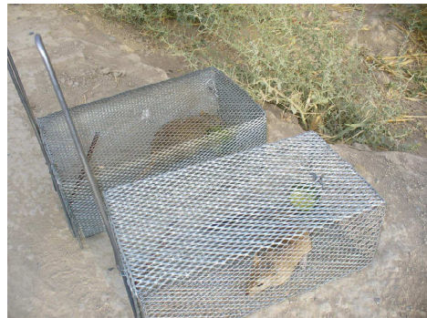
شکل ۲. جوندگان به دام‌افتاده

برای جذب موش‌ها به سمت تله‌ها، از خیار به عنوان طعمه استفاده شد. تله‌ها به گونه‌ای در دهانه‌ی لانه‌ی جوندگانه قرار داده شدند که لبه‌ی پایینی آن‌ها کمی در خاک فرو رفت تا پای موش با تله تماس پیدا نکند. همچنین تله‌ها باید طوری در محل تعبیه می‌شد که هنگام بسته شدن، درب آن به گیاهان یا سنگ گیر نکند.