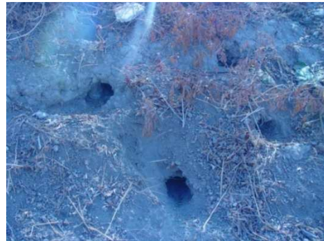
شکل ۱. نمای بیرونی لانه‌ی جوندگان منطقه

گونه‌ی جوندگان صیدشده بر اساس وضعیت دندان‌های فک بالا، وضعیت کف پا و رنگ قسمت‌های مختلف بدن به ویژه قسمت پایینی بدن و شکم و همچنین وضعیت پوزه مشخص گردید (۱۶).