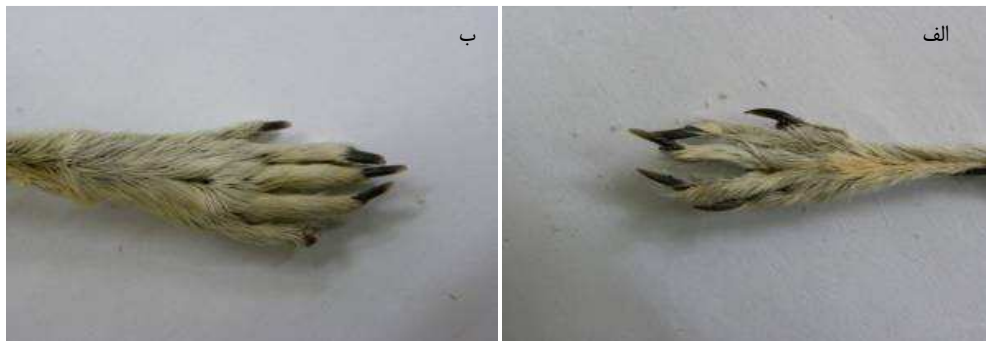
شکل ۴. وضعیت پنجه‌ی پای عقب لف- در گونه‌ی Rhombomys opimus ، ب- در گونه‌ی Meriones libycus

روستا ۴۶/۷ درصد (۷ جونده) از جوندگان صیدشده متعلق به گونه‌ی M.libycus بودند. در مجموع بیشترین تعداد جوندگی صیدشده در این مطالعه، مربوط به این روستا بود. فراوانی گونه‌های صیدشده بر حسب مناطق مورد مطالعه در جدول ۱ آورده شده است.