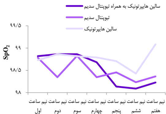
شکل ۵. میانگین میزان اشباع اکسیژن شریانی ( \text{Oxygen saturation} ) یا \text{SpO}_2 در زمان‌های مختلف در بیماران سه گروه مورد مطالعه

همچنین، مشخص شد که میانگین ضربان قلب از ساعت ۱/۵ تا انتهای ساعت سوم در گروه تیوپنتال سدیم کمترین میزان و در گروه سالین هایپر تونیک بیشترین میزان بود و این در حالی است که در تمام زمان‌های مورد مطالعه، در گروه سالین هایپر تونیک به همراه تیوپنتال سدیم در حد متوسط و با ثبات بیشتری همراه بود ( P < 0/050 ) (جدول ۲ و شکل ۳).