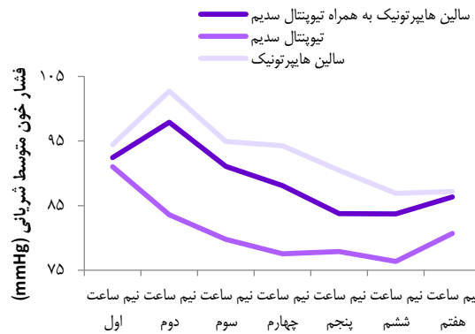
شکل ۲. میانگین فشار خون متوسط شریانی در زمان‌های مختلف در بیماران سه گروه مورد مطالعه

همچنین، در این گروه ثبات علائم همودینامیک نیز دیده شد و این در حالی است که نه تنها شرایط ریلکسیشن در گروه دریافت کننده سالین هایپر تونیک به تنهایی و یا تیوپنتال سدیم به تنهایی بدتر از گروه سالین هایپر تونیک به همراه تیوپنتال سدیم بود، بلکه در دو گروه پیش گفته، افزایش (سالین هایپر تونیک) و یا کاهش (تیوپنتال سدیم) متغیرهای همودینامیک دیده شد.