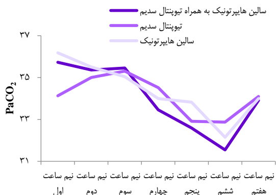
شکل ۴. میانگین Partial pressure of carbon dioxide ( \text{PaCO}_2 ) در زمان‌های مختلف در بیماران سه گروه مورد مطالعه