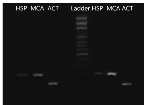
شکل ۲. الگوی الکتروفورزی تکثیر ژن‌های مورد بررسی در Candida parapsilosis قبل و بعد از تیمار (از چپ به راست)

افزایش بیان در ژن متاکاسپاز بعد از تیمار با نانوکورکومین مشهود است. همچنین، جدول ۳ مقادیر کمی این آزمایش را نشان می‌دهد.