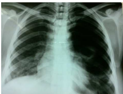
شکل ۱. پنوموتوراکس و کلاپس ریه سمت چپ

مراجعه کرد. بیمار چنین حملاتی را ماه قبل نیز داشت که با نصب لوله‌ی سینه‌ای بر طرف شده بود. بیمار شرح حال عود پنوموتوراکس را می‌داد. در رادیوگرافی قفسه‌ی سینه (شکل ۱) پنوموتوراکس و کلاپس ریه داشت. در HRCT انجام شده (شکل ۲) بولاهای متعدد دو طرفه دیده شد. در ضمن بیمار افیوژن پلور سروزی نیز داشت (شکل ۳).