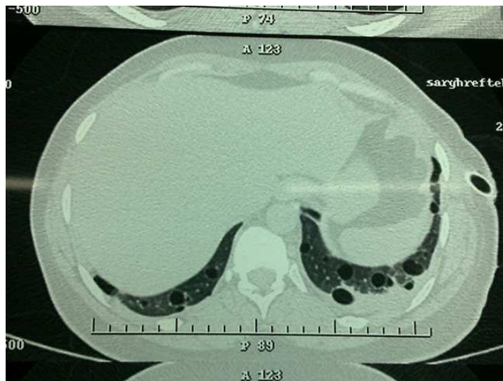
شکل ۳. پلورال افیوژن سروزی خفیف سمت چپ