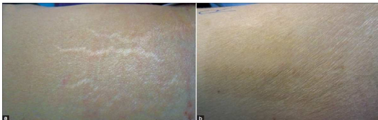
شکل ۱. استریا دیستنسا در پهلوی راست در یک بیمار. نشان دهنده‌ی بهبودی معنی‌دار در ۱۲ هفته بعد از درمان. الف: در آغاز درمان، ب: پس از ۵ جلسه فوتوترمولیز فراکشنال