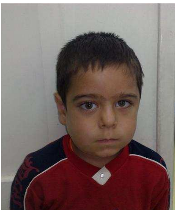
شکل ۱. بیمار با شکایت ضایعه‌ی بدون درد منفرد استخوان فک تحتانی سمت چپ مراجعه نمود.

سنتی متر با گسترش به سمت ناحیه‌ی خلفی - تحتانی استخوان فک تحتانی مشاهده و لمس شد. در معاینه‌ی برآمدگی (توده) از طرف داخل دهانی مورد خاصی مشاهده نشد. در ناحیه‌ی تحت فکی، لنفادنوپاتی وجود نداشت. یافته‌های حاصل از معاینه‌ی فیزیکی احتمال کیست پریدنتال و یا استئومیلیت مزمن را مطرح کرد.