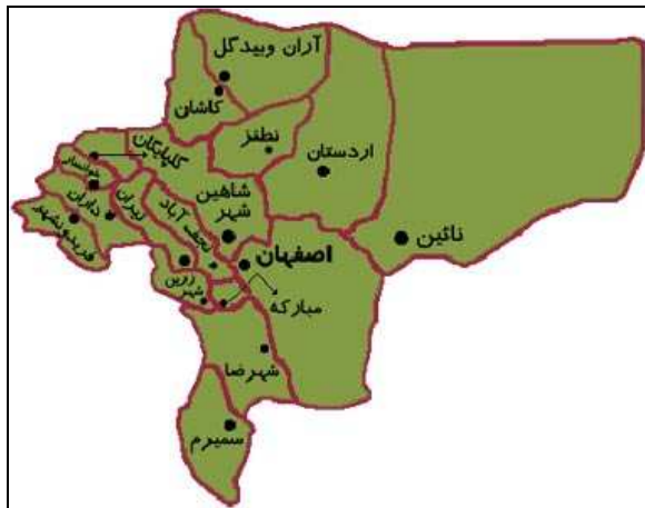
شکل ۲. موقعیت محدوده‌ی مورد مطالعه

روان‌پزشکان مراکز بهداشت شهرستان مربوط، پرونده‌ی اختلالات روانی و رفتاری داشتند. اطلاعات به دست آمده در چک لیست‌های مربوط وارد شد و پس از تکمیل توسط نرم‌افزار SPSS (SPSS Inc., Chicago, IL) و با استفاده از آزمون‌های آماری مورد تجزیه و تحلیل قرار گرفت.