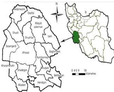
شکل ۱. نقشه و موقعیت منطقه‌ی مورد مطالعه (شهرستان دزفول)

این مطالعه به صورت یک بررسی توصیفی - مقطعی طراحی گردید. این منطقه مورد مطالعه، شهرستان دزفول از شهرستان‌های استان خوزستان در جنوب غربی ایران است که با مساحت ۷۸۸۴ کیلومترمربع در شمال استان خوزستان قرار دارد. این منطقه، دشتی بین طول جغرافیایی ۱۸° ۴۸ تا ۳۳° ۴۹ شرقی و عرض جغرافیایی ۵۹° ۳۱ تا ۵۷° ۳۲ شمالی قرار دارد (شکل ۱).