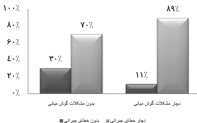
نمودار ۲. مقایسه‌ی وضعیت تولیدی بیماران در گروه‌های با و بدون مشکلات گوش میانی

همکاران نشان داد که در ۵۵ درصد از کودکان مبتلا به شکاف، کم شنوایی ناشی از اوتیت گوش میانی مشاهده می‌شود (۹). اکثر پژوهشگران، دوره‌های تکرار شونده‌ی اوتیت گوش میانی در مراحل اولیه‌ی زندگی و کاهش حساسیت شنوایی همراه با آن را، از علل آسیب در روند رشد شناختی و زبانی کودکان دانسته‌اند. همچنین آن‌ها فراوانی بیش‌تر یافته‌های غیرطبیعی گفتاری از جمله پرخیشومی و اختلالات تولیدی را در بین کودکان مبتلا به شکاف کام و کم شنوایی همراه، گزارش نموده‌اند (۱). در مطالعه‌ی حاضر نیز فراوانی خطاهای جبرانی تولید در گروه دچار مشکلات گوش میانی بیش‌تر از گروه بدون مشکلات گوش میانی بود. همچنین میانگین نمره‌ی پرخیشومی در گروه دچار مشکلات گوش میانی بیش‌تر بود. ولی تفاوت‌های مشاهده شده از نظر آماری معنی‌دار نبود که ممکن است ناشی از پایین بودن حجم نمونه باشد و با افزایش تعداد نمونه‌ها، نتایج به سمت معنی‌داری میل نماید.