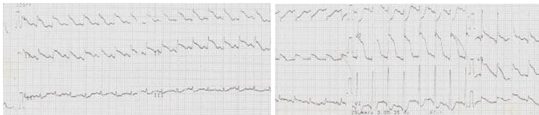
شکل 1. در این شکل تغییرات تحتانی و آنتروسپتال در ECG بیمار دیده می‌شود.

(Jugular vein pressure یا JVP) افزایش داشت و معاینه‌ی قلبی او حاکی از طبیعی بودن صداهای قلبی بدون وجود سوفل بود. در معاینه‌ی ریه، کراکل‌های ریز (Fine) تحتانی دو طرفه سمع شد. در ECG بیمار افزایش قابل توجه سطح قطعه‌ی ST در لیدهای تحتانی و آنتروسپتال (قدامی - جداری) دیده شد (شکل 1). سطح تروپونین سرم نیز به 10 نانوگرم در میلی‌لیتر افزایش یافته بود. آنژیوگرافی عروق کرونر نیز انجام شد و هیچ ضایعه‌ی انسدادی کرونر را نشان نداد (شکل 2A و 2B). ونتریکولوگرام بطن چپ اتساع آپکس را به همراه ظاهر کاردیومیوپاتی تاکتوسوبو و کسر جهشی قلبی 20 درصد را نشان داد (شکل 3).