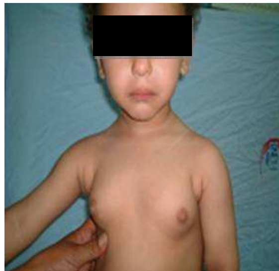
شکل ۱. دختر ۱/۵ ساله با علائم بلوغ

یک دختر ۱/۵ ساله اهل توپسرکان که به علت بزرگی هر دو پستان (شکل ۱)، رویش موهای زهار و زیر بغل که از حدود یک سال پیش شروع شده بود، به درمانگاه غدد ارجاع داده شد. تولد وی به روش طبیعی با سن حاملگی ۴۰ هفته و فرزند اول خانواده از والدین غیر منسوب بود. هیچ شرح حالی از بیماری مشابه در اعضای خانواده وجود نداشت. در معاینه‌ی قد بیمار ۸۵ سانتی‌متر (منحنی ۹۰ پرستایل)، وزن ۱۳ کیلوگرم (منحنی ۹۰ پرستایل)، سن استخوانی ۲/۵ سال، پستان‌ها در مرحله‌ی ۳ بلوغی (SMR یا Sexual maturation rate) و موهای زهار در مرحله‌ی ۲ بلوغی (SMR) بود.